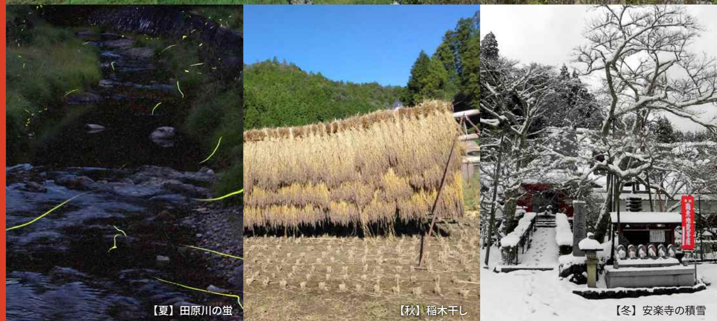
【夏】田原川の魚 【秋】稲木干し 【冬】安楽寺の積雪

日吉町佐々江(ささえ)は京都府南丹市日吉町の最も東に位置します。東は京都市右京区、北は南丹市美山町に隣接する人口120人ほどの集落です。京都市右京区の福王子交差点から約30km(車で45分)に位置し、京都市内の職場や観光地へもアクセスのよい地域で、若狭の海まで約1時間の場所です。佐々江は移住していただくにあたって、本当の田舎好きには少し物足りないかもしれません。いわゆる中途半端な田舎とも言える佐々江の魅力を少しでもお伝えできればと思います。一番の魅力は、自然環境のよさと住人の優しさです。編纂には移住者も加わり、移住者視点の議論もしました。佐々江に移住を考えておられる方に、少しでも参考になれば幸いです。